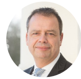
Jack van der Hoek Gedeputeerde Duurzaamheid, Provincie Noord-Holland