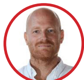
Rinse van der Woude City Hub