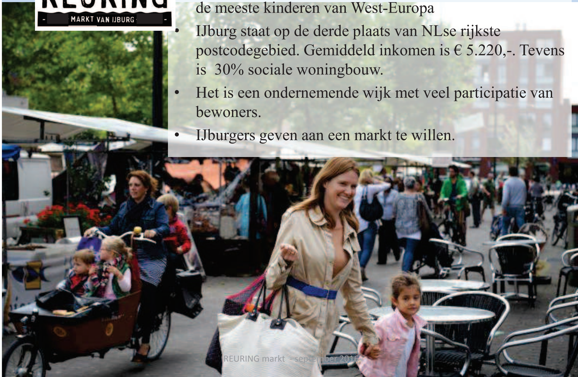
REURING markt - september 2016