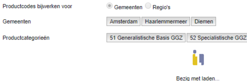
Figuur 7: voortgangsmelding ‘Bezig met laden...’

Hierna klik je op de knop ‘Volgende’, waarna de tekst ‘Bezig met laden...’ verschijnt ( zie figuur 7 ).