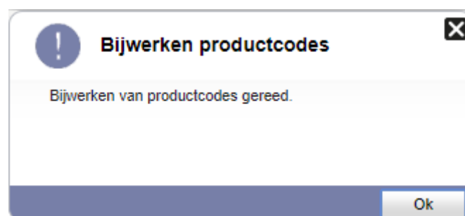
Figuur 10: pop-up bijwerken productcodes

Na het klikken op de knop 'Doorvoeren' verschijnt uiteindelijk de pop-up 'Bijwerken productcodes gereed' ter bevestiging.