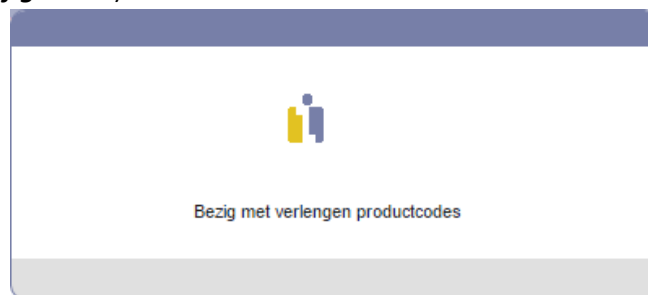
Figuur 16: voortgangspop-up verlengen van productcodes

Na het selecteren van de gemeente en het klikken op de knop ‘Verlengen’ verschijnt een voortgangspop-up (zie figuur 16 ).