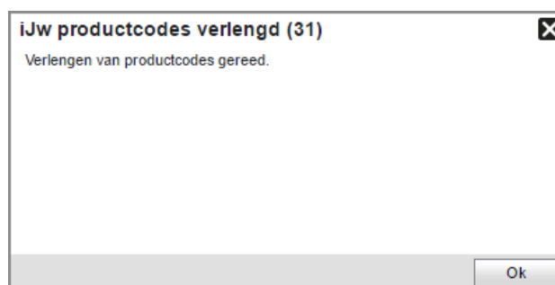
Figuur 17: bevestigingsmelding dat verlengen is gelukt

Zodra het verlengen is voltooid, verschijnt er een bericht waarin dit wordt bevestigd (zie figuur 17 ).