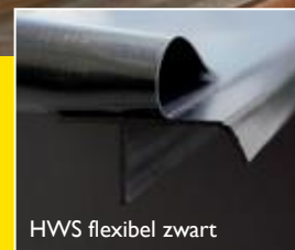
HWS flexibel zwart