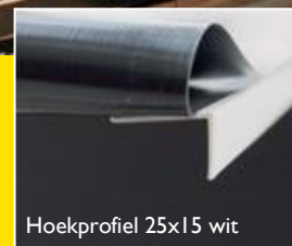
Hoekprofiel 25x15 wit