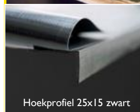
Hoekprofiel 25x15 zwart