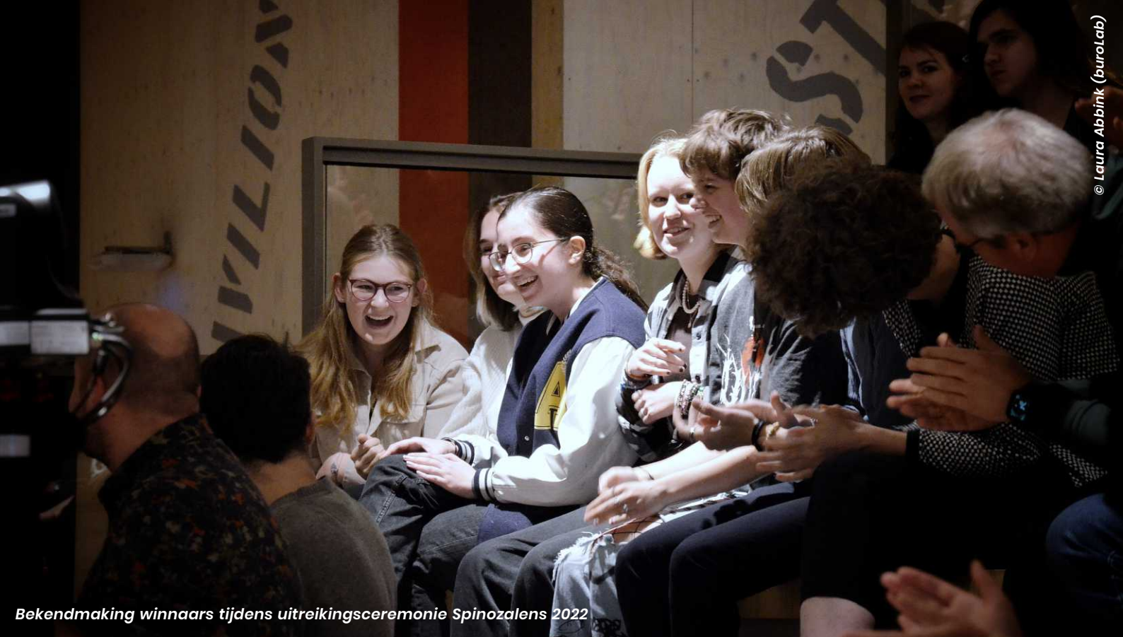
Bekendmaking winnaars tijdens uitreikingsceremonie Spinozalens 2022

Men noemt het project 'goed georganiseerd' en 'didactisch sterk neergezet'. Betekenisvoller onderwijs bestaat volgens mij niet!', stelt een docent. De video's met mini-masterclasses krijgen een acht. Twee docenten vinden de filmpjes iets te kinderachtig, een andere docent vindt de kwaliteit van de belichting en het geluid matig. De templates voor leerlingen worden met een 8,5 gewaardeerd. Eén docent schrijft: 'Mijn leerlingen hebben er echt iets van geleerd.'