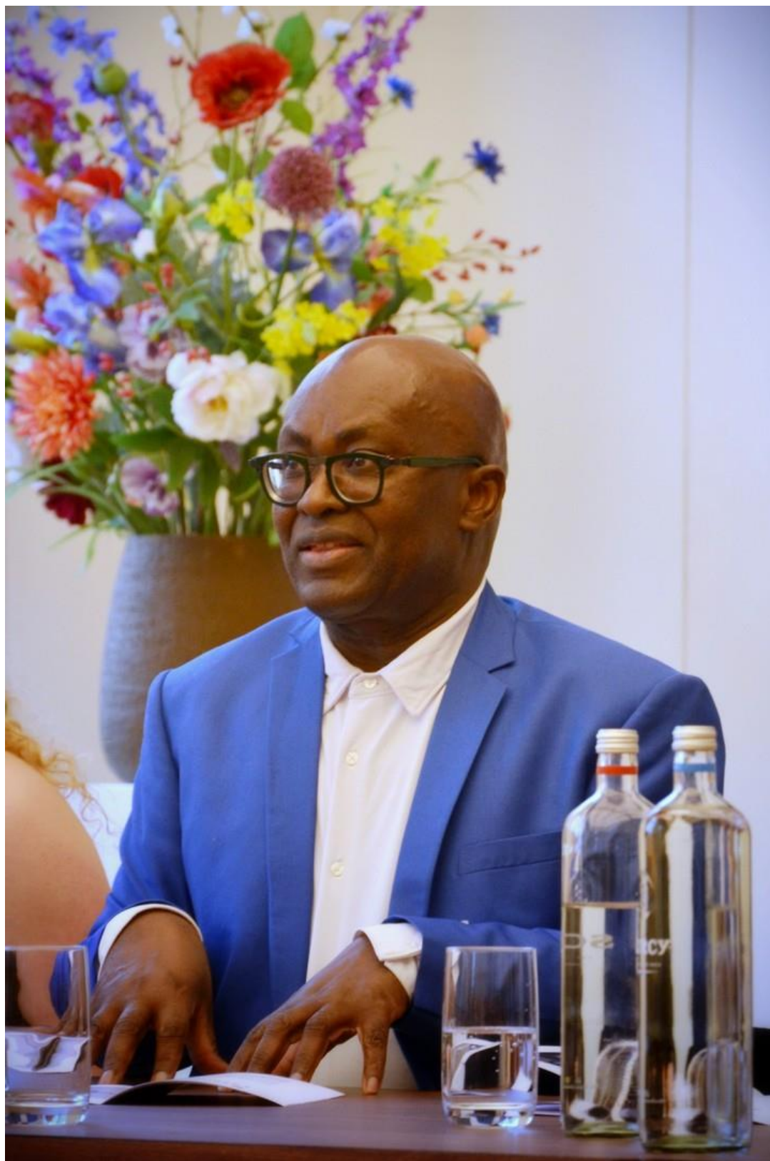
Laureaat Achille Mbembe in gesprek met de finalisten van het educatieproject.