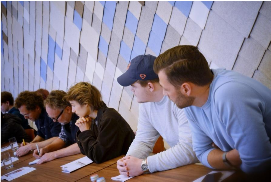
Twee studenten en een docent op het puntje van hun stoel (Meet & Greet).

De finalisten en hun docenten waarden de training tijdens de finalistendag met gemiddeld een 3,6 – met scores variërend van een 2 tot een 5. De hbo-docent vond het programma te lang. Haar Engelstalige studenten konden de plenaire gedeeltes vaak niet volgen, omdat er te snel naar het Nederlands werd geschakeld. Achteraf kun je je afvragen hoe zinvol het was om plenaire onderdelen te programmeren voor zo'n divers gezelschap (wat type onderwijs, leeftijd en moedertaal betreft). De kroon op dag is zonder meer de presentatie van de finalisten – vijf teams en twee individuele presentaties – aan de jury. Ze waarden de inhoudelijke vragen de juryleden met een gemiddelde score van 4,7 en voelen zich ook op hun gemak tijdens het jureren.