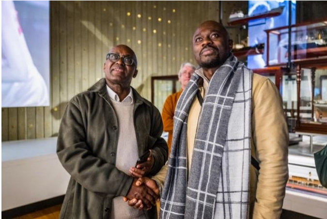
Mbembe wordt rondgeleid in het MAS

Afrika-museum van Tervuren werd tentoongesteld. Daarna geeft Mbembe een lezing over eerherstel en gestolen erfgoed en krijgt hij een rondleiding in het museum.