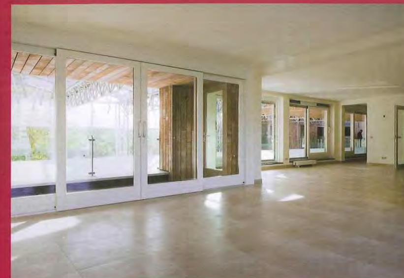
Interieur van royale woningen is koninkrijk afgewerkt met stucwerk van stukadoorsbedrijf de Koning. Hier de oriëntatie op de lichte, glazen cour.

Voor dit zeer luxe appartementen complex, realiseerde Bovema Glas in opdracht van bouwkundige aannemer Hillen & Roosen, het prestigieuze glazen atrium. In de ontwerp-fase is Bovema Glas al bij dit architectonisch hoogstandje betrokken, gezien de gecompliceerde technische invulling van het glazen atrium. Er zijn natuurlijk hoge eisen gesteld