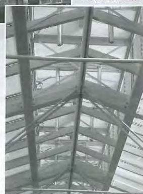
Rook- en warmteafvoer