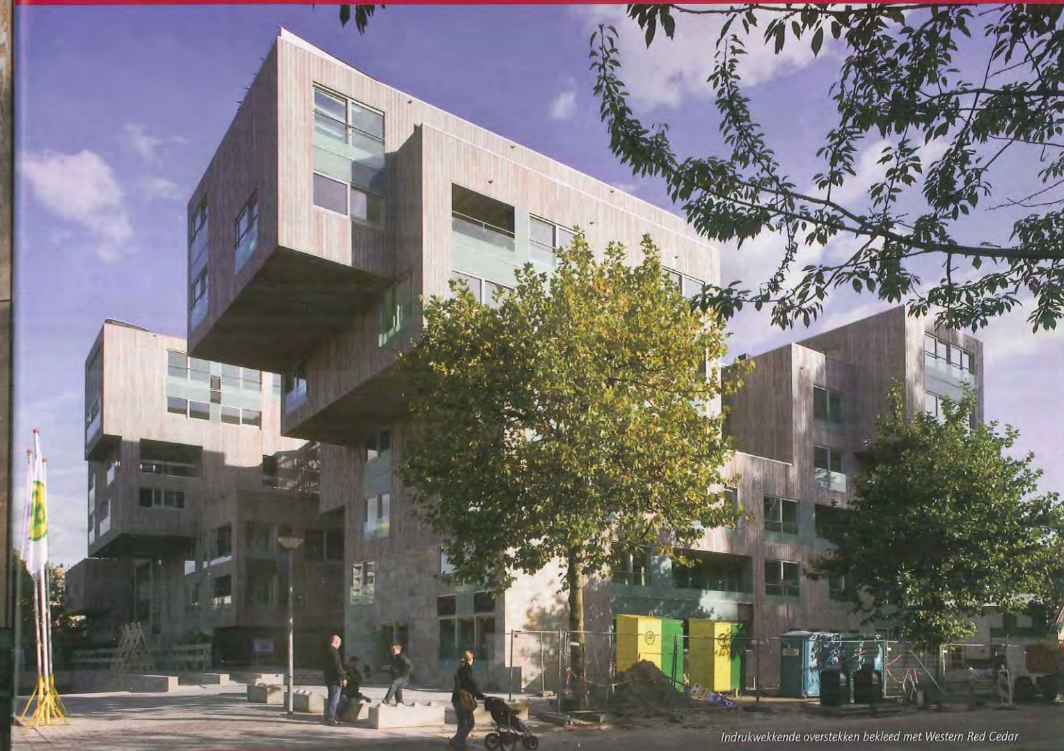
Indrukwekkende overstekken bekleed met Western Red Cedar