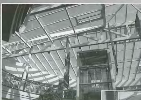
Glasdaken 60 minuten brandwerend