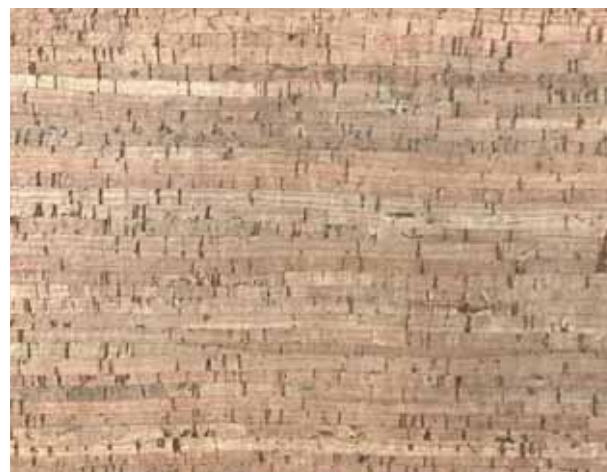
FOTO'S Vier van de voor het interieur gebruikte materialen.